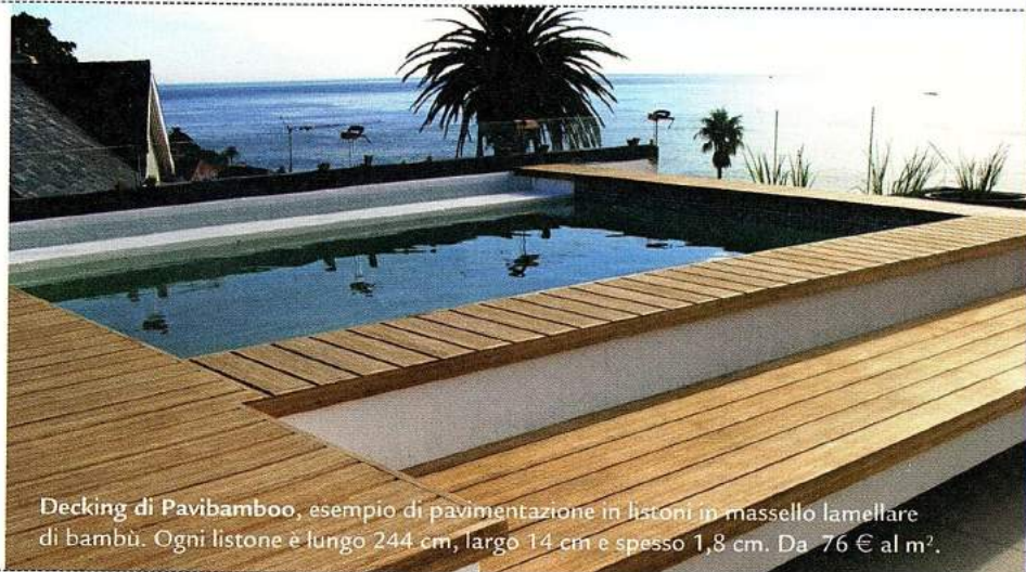
Decking di Pavibamboo , esempio di pavimentazione in listoni in massello lamellare di bambù. Ogni listone è lungo 244 cm, largo 14 cm e spesso 1,8 cm. Da 76 € al m 2 .