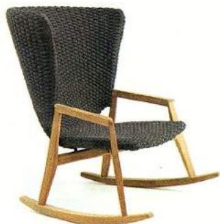
Knit rocking chair di Ethimo , dondolo di 88x78x110 cm, in tek e fibra sintetica intrecciata. Prezzo su richiesta. Pallas di Magis e Iittala , scultura luminosa a forma di gufo, in policarbonato. Misure e prezzi su richiesta.