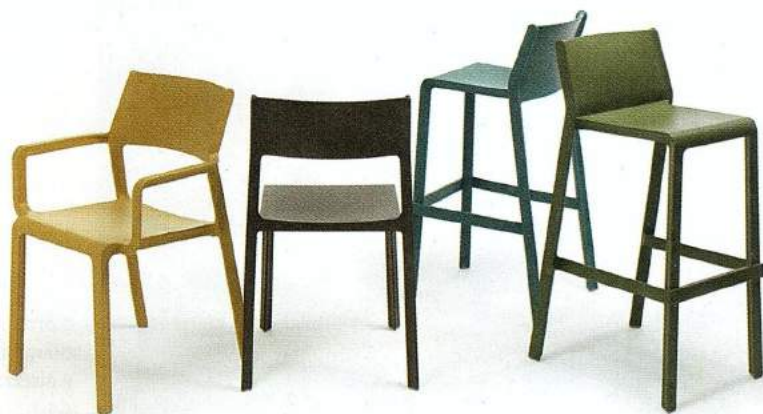
Trill di Nardi , collezione di sgabelli e sedie con e senza braccioli in resina fiberglass. In otto colori diversi, la sedia senza braccioli misura 50x51,5xh82,6 cm e costa 93 €.