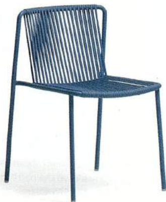
Tribeca di Pedrali , sedia disegnata da Mandelli Pagliarulo in tubolare di acciaio verniciato con incordatura in pvc di seduta e schienale. Impilabile, misura 53,5x54xh76,5 cm. Da 279 €.