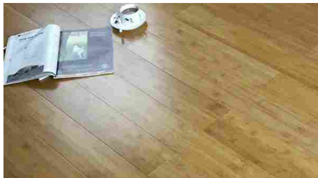
Pavibamboo color caffè

Il pavimento in legno bamboo offerto da Pavibamboo >> azienda specializzata nella selezione e distribuzione di parquet in bamboo di qualità, affiliata a Gbc Italia, si distingue per le caratteristiche di resistenza, attenzione all'ambiente, utilizzo sostenibile del bamboo, finiture ecologiche non tossiche. Il pavimento in bamboo è una scelta che unisce la bellezza del classico parquet a un elevato grado di robustezza oltre alla sostenibilità garantita dalla natura rinnovabile della materia prima, una pianta che raggiunge l'altezza adatta al taglio in soli 5 anni.